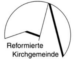
Reformierte Kirchgemeinde Wünnewil - Flamatt - Ueberstorf